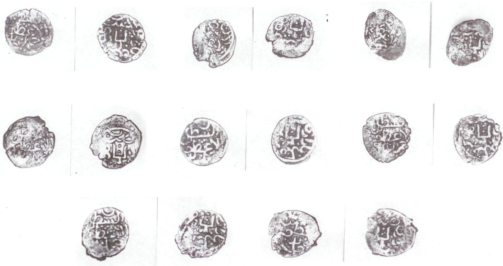
Рис. 2 Джучидские монеты Ахмада, выпущенные в Тимур Бик -Базаре ОН ГЭ. (Инв 24713-24715, 24717-2472)